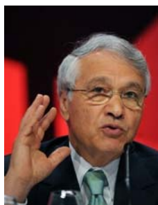
Dr Chakib Khelil Ministre de l'énergie et des mines, Algérie

« Développement des relations Algérie-Suisse dans le domaine économique ».