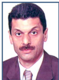
Mr Karim Djoudi Ministre des Finances, Algérie